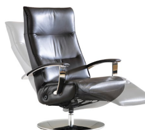
Lehnen- und Fußverstellung Gesamttiefe inkl. Verstellungen: ca. 172 cm

⚠ Maximale Gewichtsbelastung: ca. 120 kg!