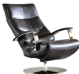
Lehnenverstellung Gesamttiefe inkl. Verstellung: ca. 132 cm