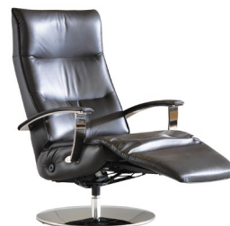
Fußverstellung Gesamttiefe inkl. Verstellung: ca. 130 cm

Polsterung: Legere. Eine modellbedingte Wellenbildung der Bezüge ist warentypisch.